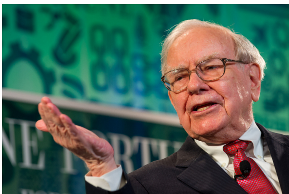
วอร์เรน บัฟเฟตต์ (Warren Buffet)

“ความเสี่ยง คือ การที่คุณไม่รู้ว่าคุณเอง กำลังทำอะไรอยู่”